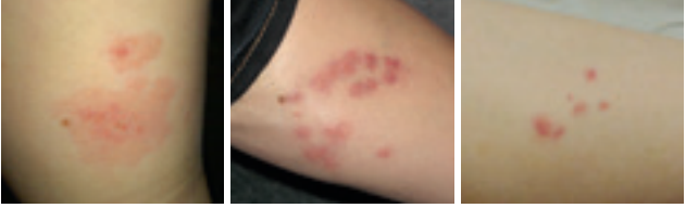
Abb. 3: Beispiele für Bettwanzenstiche

Die Hautreaktion nach einem Stich kann von Person zu Person sehr unterschiedlich ausfallen (siehe Abbildung 3). Manche Menschen zeigen gar keine Reaktion, andere haben juckende und gerötete Pusteln (Durchmesser wenige Millimeter bis einige Zentimeter) oder Blasen und Quaddeln. Die Reaktion kann auch zeitlich verzögert auftreten (bis zu 10 Tage). Daher kann es manchmal schwierig sein zu bestimmen, an welchem Ort man gestochen wurde. Bettwanzenstiche sind meistens gruppenweise bzw. in Reihe angeordnet, können aber auch einzeln auftreten.